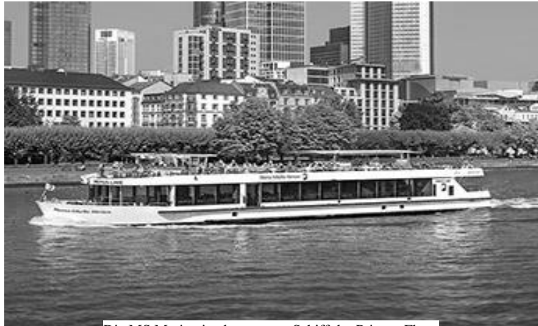
Die MS Merian ist das neueste Schiff der Primus-Flotte

Beginn ist um 15.00 Uhr und Ende um 18.00 Uhr